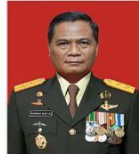
MAYOR JENDERAL TNI NUGROHO BUDI W PANGDAM III/SILIWANGI